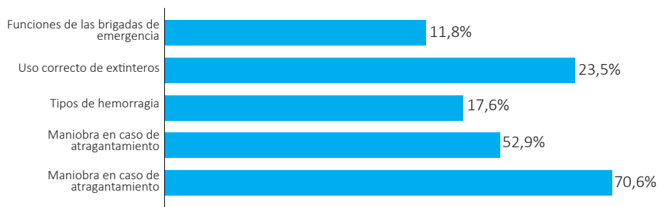
Figura 2. Porcentaje de respuestas correctas en conocimientos básicos de preparación ante emergencias y desastres

Los resultados muestran un nivel moderado de conocimientos básicos, con variaciones significativas según el tema. El 70,6% de las personas participantes identificaron correctamente el primer paso a seguir ante una emergencia, pero solo el 41,2% conoció las funciones correctas de las brigadas de emergencia.