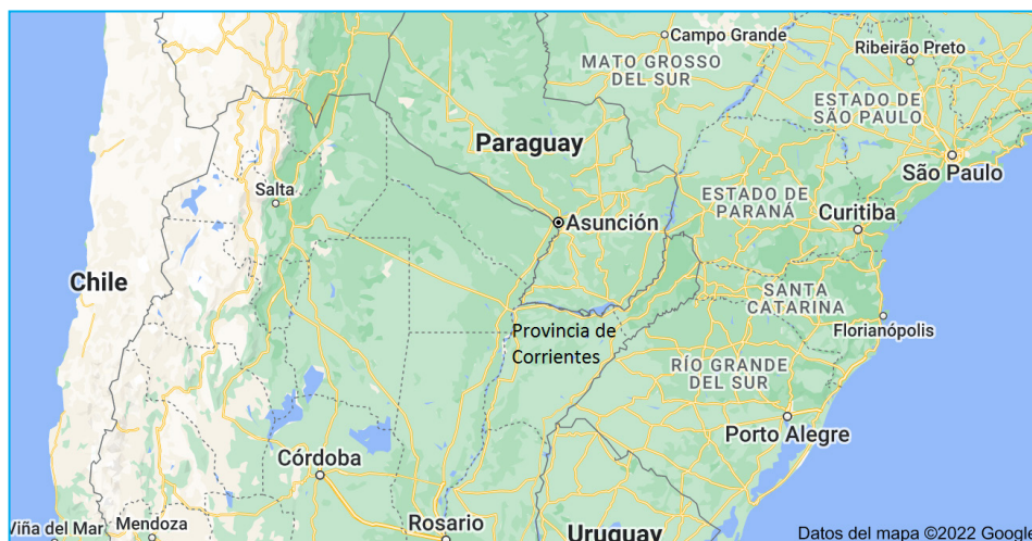
Figura 1. Paraguay, nordeste argentino, sur de Brasil y Norte de Uruguay en Sudamérica